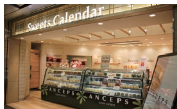
スイーツカレンダー(横浜店)

お客さまの多様なニーズに応えるため、鉄道ファンをはじめ多くのお客さまにご利用いただいている京急グッズショップ「おとどけいきゅう」鮫洲店や、話題のスイーツショップが入れ替わりに登場する「スイーツカレンダー」(4店舗)など、魅力ある店舗を展開しています。また、オープン型宅配ロッカーを20駅に設置し、駅利用者へさらなる利便性を提供しています。