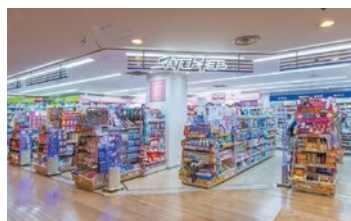
マツモトキヨシ ウィング高輪店

ドラッグストア「マツモトキヨシ」を京急沿線で6店舗展開。医薬品・日用品・化粧品など地域、お客さまのニーズにあった商品を取り揃えています。また、京急羽田空港国際線ターミナル駅店・ウィング高輪店・京急鶴見店においては、年々増加する外国人旅行者の方々の要望に応えるため、免税対応店舗となっています。