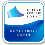
このマークが目印