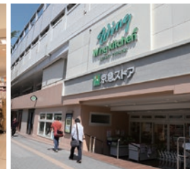
京急ストア京急鶴見店