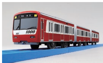
京急新1000形 マイナーチェンジ車

京急の電車やバスをモチーフにした、さまざまな京急オリジナルグッズを企画・販売しています。キャラクターや玩具・文具メーカーとのコラボレーショングッズは、鉄道ファンのみならず、幅広いお客さまに人気を得ています。2017年4月、横浜港大さん橋国際旅客ターミナル内に、京急グッズを中心としたショップ「おとどけいきゅうプラス」を出店しました。