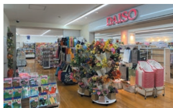
ダイソー-上大岡店

ワンコインの力で、買物を、暮らしを、世の中を、もっとワクワクさせていく、豊富な品揃えと高いクオリティの商品をワンコインで提供する「ダイソー」を京急沿線で1店舗展開しています。