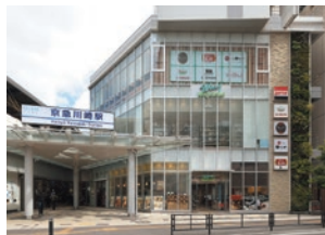
ウィングキッチン京急川崎