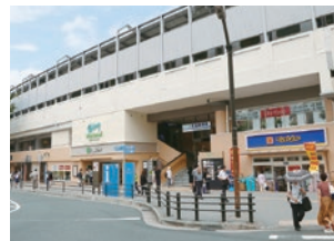
ウィングキッチン京急鶴見