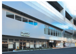
ウィングキッチン京急蒲田