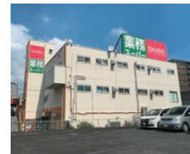
業務スーパー 上大岡店

高品質・ロープライスの「業務スーパー」を京急沿線で3店舗展開。世界の国々から直輸入した本場の食材や、美味しさと安全性にこだわった国内工場で作るオリジナル商品などプロの方はもちろん、毎日の食卓を豊かにする商品を「毎日がお買得」をコンセプトに「プロの品質とプロの価格」で提供しています。