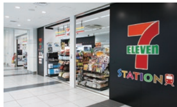
セブン-イレブン京急ST 羽田空港国際線ターミナル店

セブン-イレブン・ジャパンと提携し、京急沿線および、みなとみらい線沿線で「セブン-イレブン」を28駅43店舗に展開。また、京急EXイン 羽田および横須賀岡田屋モアーズ社員休憩室内にセブン-イレブン自販機の設置や、三浦市内の買物不便地域への移動販売車による「あんしんお届け便」などを展開しています。