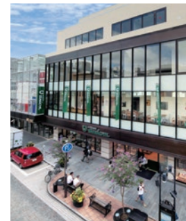
もともちユニオン元町店

高質スーパーとしてお客さまのニーズにお応えする「もともちユニオン」。2011年には元町商店街の「もともちユニオン元町店」を全面建て替え、グランドオープンしたことに続き、都心部の新宿・六本木に進出、2019年5月1日には京急百貨店地下1階に「もともちユニオン上大岡店」をオープン。個性ある商品の品揃え、さらには商品知識の高いスタッフによる接客などを通じ、もともちユニオンブランドの浸透に努めています。