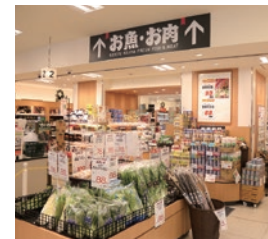
京急ストア稲谷店

京急沿線のお客さまを中心に、「安全・安心」な商品・サービスを、日々、お届けする「京急ストア」。地域に根差すスーパーマーケットとして、神奈川県と「連携と協力に関する包括協定」を締結し、自治体との連携や地産地消、産業活性化を推進し、地域社会と一体となり、明日の「食」を考えていきます。