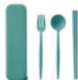
カトラリーセット