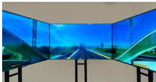
「3面モニターイメージ(川崎鶴見臨港バス)」 「3面モニターイメージ(小田急ロマンスカーVSE)」