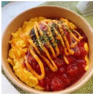
【丘の上のお弁当屋さん/ オムバーグ Bowl】