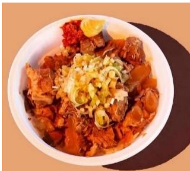
【提灯東京/バラナン丼】