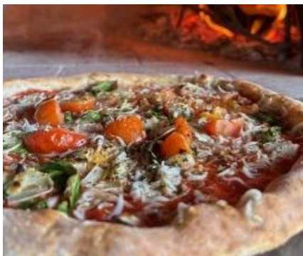
【Daddy's Pizza /SHIRASU GARIC ピザ】