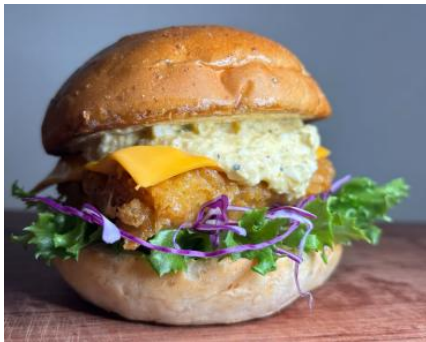
【Rokks/フィッシュバーガー】