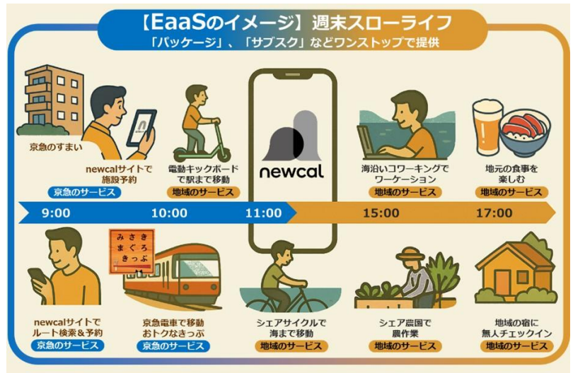
EaaSが実現するカスタマージャーニー