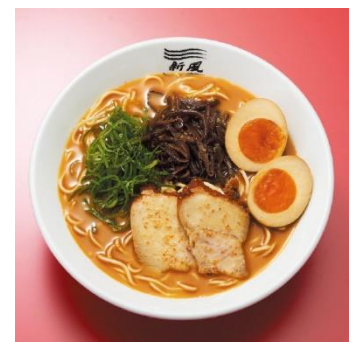
旨みと辛みのバランスが 絶妙な一杯