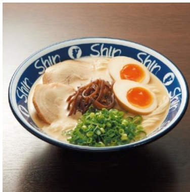
煮たまごら一めん