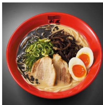
焦がしニンニクの マー油が効いた一杯