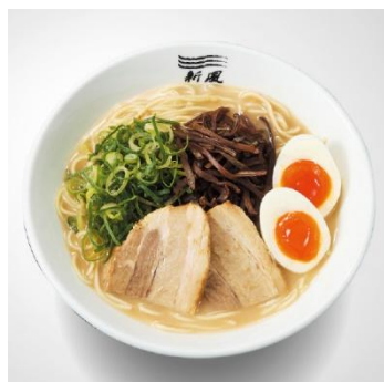
濃厚で上品なスープ