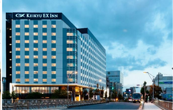
京急 EX イン 羽田