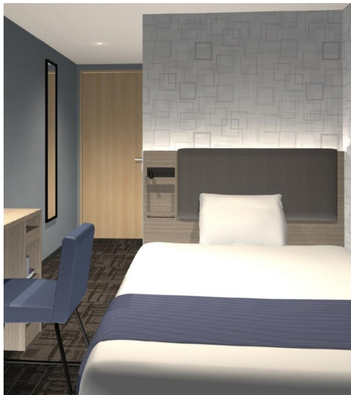
京急 EX イン 横浜駅東口

株式会社京急イーエックスイン（本社：横浜市西区，取締役社長：染崎素洋，以下 京急イーエックスイン）は、「京急 EX ホテル 高輪」と「京急 EX イン 横浜駅東口」の2ホテルを，2026年2月27日（金），同時にリニューアルオープンいたします。