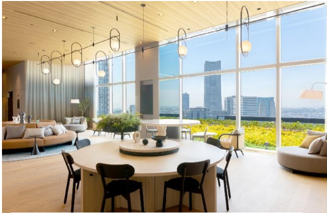
京急 EX ホテル みなとみらい横浜

2007年設立。羽田空港や品川駅などのターミナル駅をはじめ、交通の利便性が高い立地に「京急 EX ホテル / 京急 EX イン」の2つのブランドで宿泊特化型ホテルを15施設展開しています。ホテルでは全室カードキーシステムを採用しているほか、シモンズ社と共同開発した最上の眠りを誘うオリジナルマットレスを導入（一部客室を除く）。利便性に富んだアクセスだけでなく、“上質のくつろぎ”と“安心できるサービス”を提供し、お客様に選ばれ、喜ばれるホテルを目指しています。