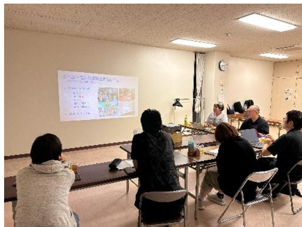
はじまりゼミの様子