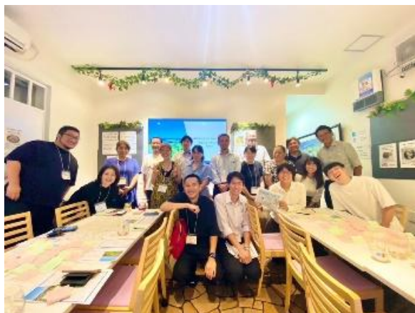
じわじわ，へいわじまメンバー

京急電鉄と大田区は，今後も民間企業と自治体の双方の強みを活用しながら，連携した取り組みを進め，地域の発展に貢献してまいります。詳細は別紙のとおりです。