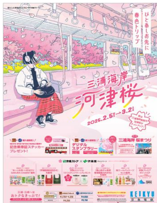
キャンペーンポスター