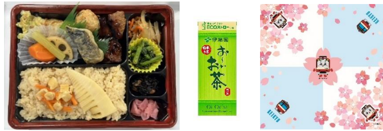
春満載 幕の内弁当 (イメージ)