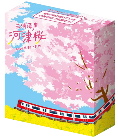
京急オリジナルデザインのお菓子 「小枝」

ホ. 参加方法 デジタルスタンプラリーサイト「みんラリ」にアカウント登録し、スタンプ取得スポットに設置された二次元コードを読み取っていただくことで、スタンプを獲得できます。