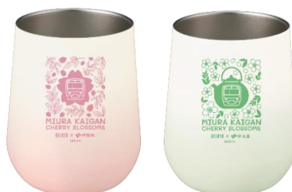
さくらタンブラー（イメージ）