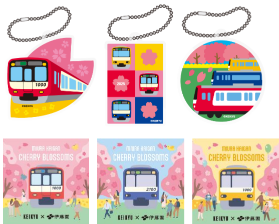
KEIKYU SAKURA CHARM