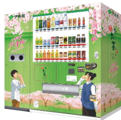
伊藤園桜ラッピング自販機 （イメージ）