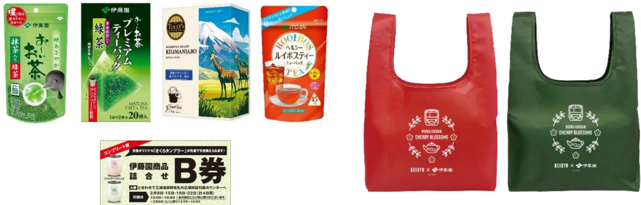
伊藤園商品詰合せ（イメージ）