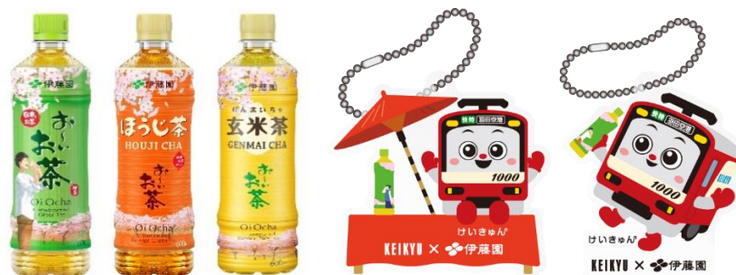
伊藤園お〜いお茶桜エールパッケージセット (イメージ)