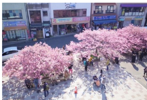
満開の三浦海岸河津桜 (イメージ)