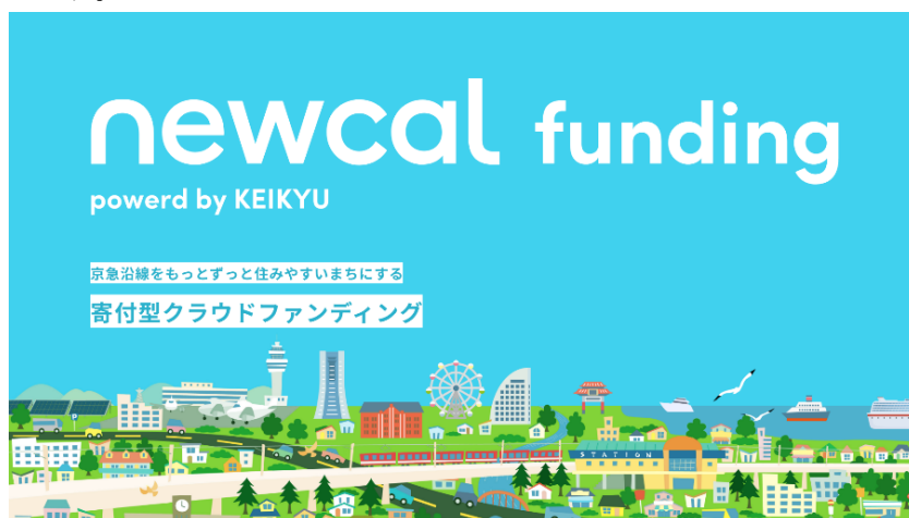
キービジュアルイメージ