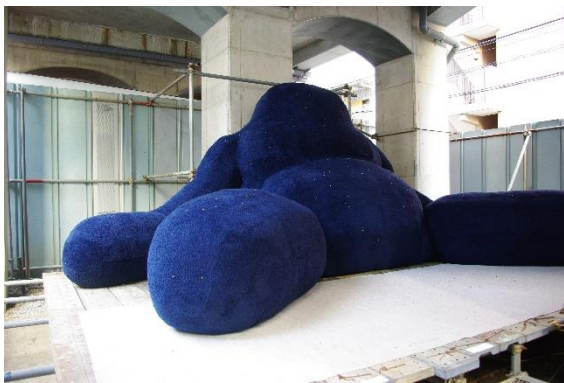
さとうりさ メダム K/Mmes. K 2011