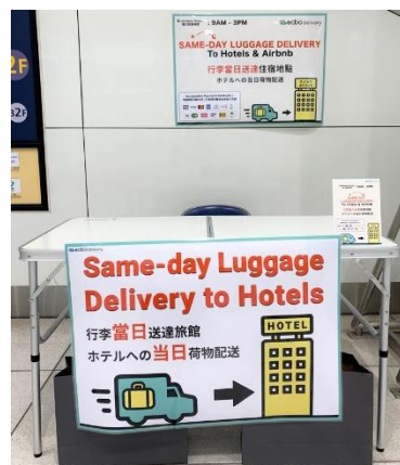
特設カウンター（イメージ）