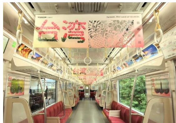
「ビビビビ！台湾号」車内