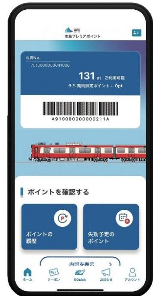
アプリイメージ画像