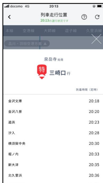
列車走行位置詳細画面（平常運行時）

※走行位置、運行種別、方向、行先、各駅到着時刻は、実際と異なる場合や変更となる場合があります。