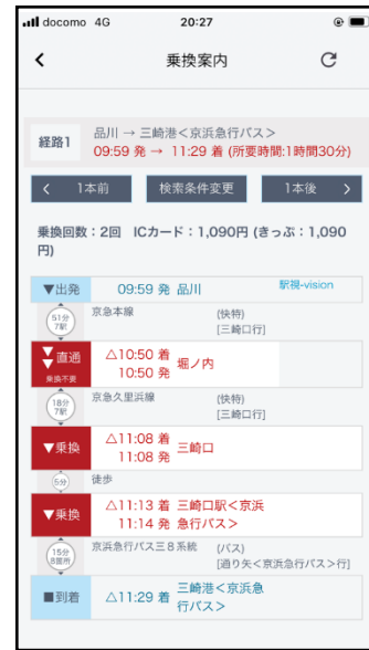
乗換案内検索結果画面