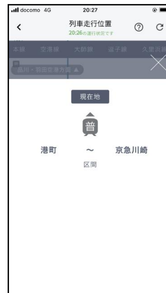
列車走行位置詳細画面（異常時）