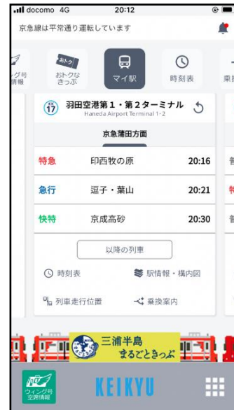
リニューアル後ホーム画面