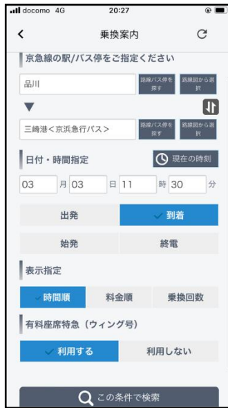
乗換案内ホーム画面