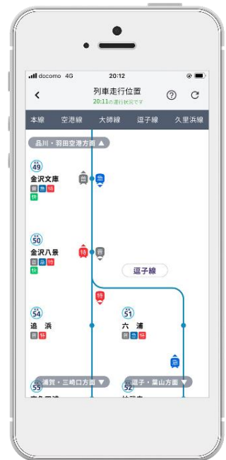
列車走行位置画面