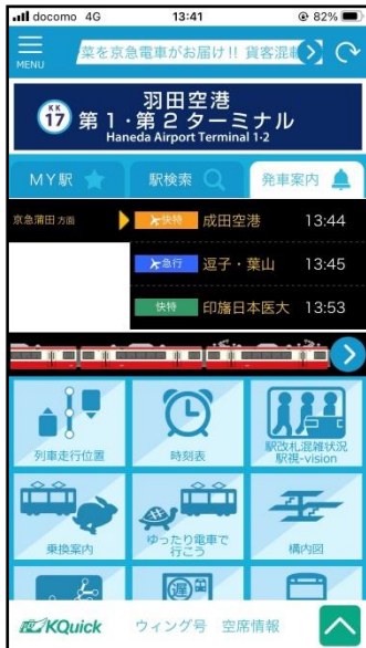
リニューアル前ホーム画面

マイ駅に登録された駅の情報をもつ画面に収めることで、「見たいことや知りたいこと」がすぐ確認できる直観的なデザインにリニューアルします。