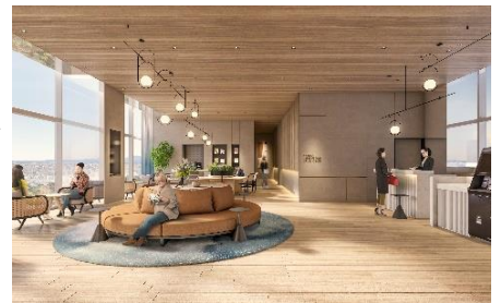
ホテルロビーイメージ