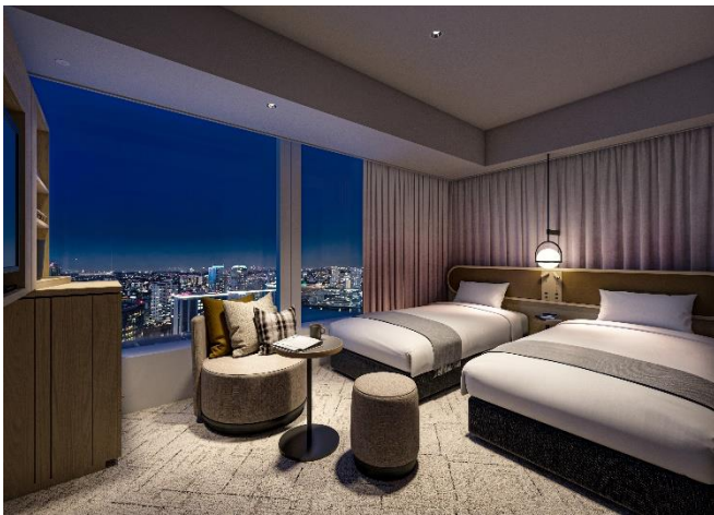
ツインルームイメージ