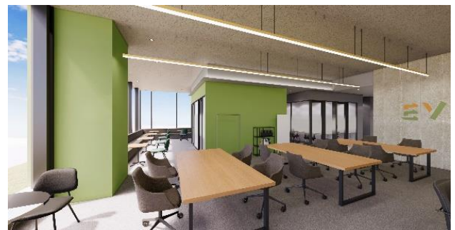
フリーアドレス席イメージ