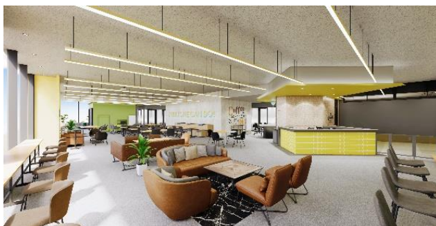
フリーアドレス席イメージ