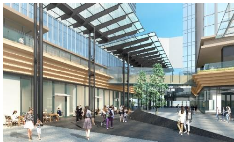
低層部商業ゾーンイメージ