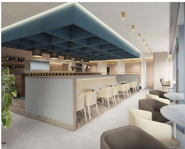
Aging beef & Specialty coffee THE 三本 イメージ