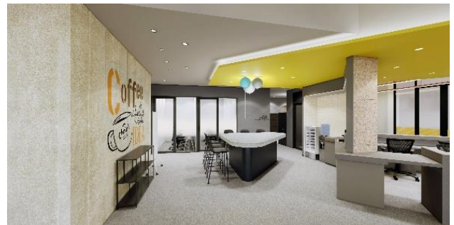
カフェスペースイメージ