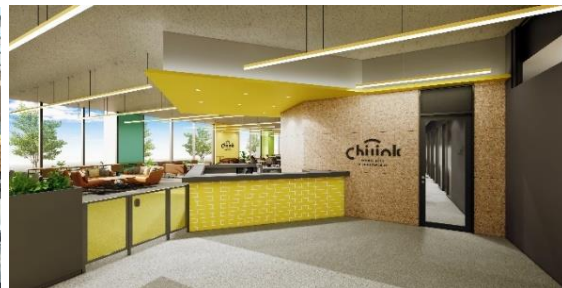
オープンバージョンオフィス イメージ