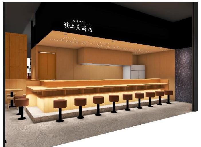
新高島 de 焼肉 DOURAKU×横濱中華そば 上星商店 イメージ