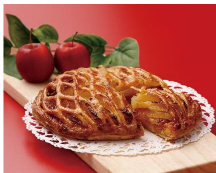
【青森県 コマモシフォン】