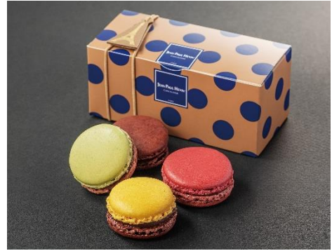
マカロン 4個 SV 1,458円（税込）