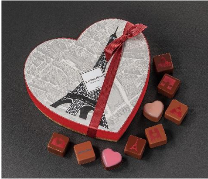
ボンボン ショコラ 9個 パリ フォーエバー 6,048円（税込）