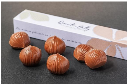
コフレ マロン6P （6コ入）3,672円（税込）