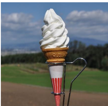
【群馬県 みるく工房タンポポ】