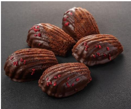
至福のマドレーヌショコラ