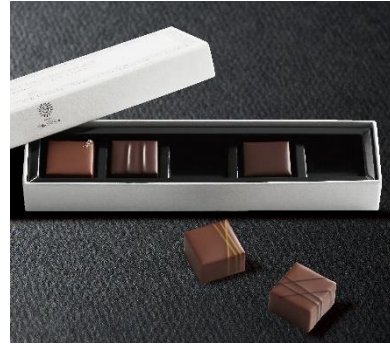
ボンボンショコラ 5