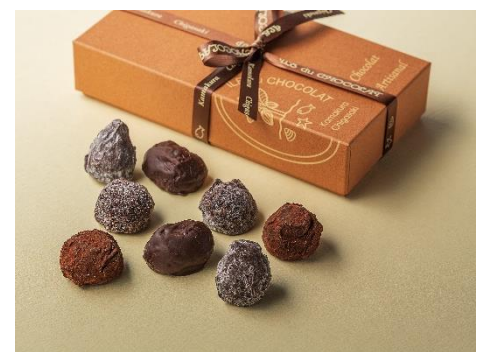
トリュフ・ショコラ