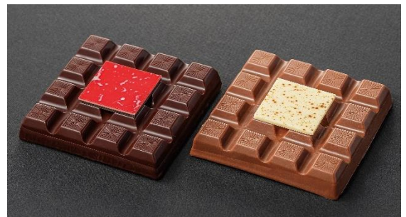
タブレット ヴァニニュー フレーズ/モンブラン （1枚）各2,916円（税込）