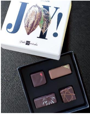
ヨロイツカコレクション 2024