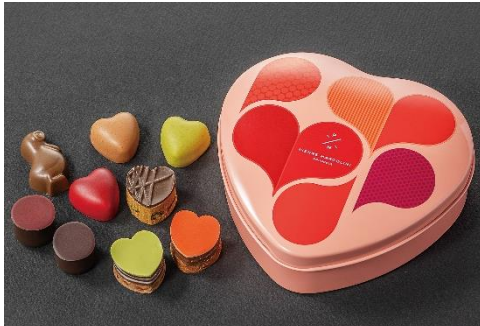
コフレ クール9個入り 4,428円（税込）