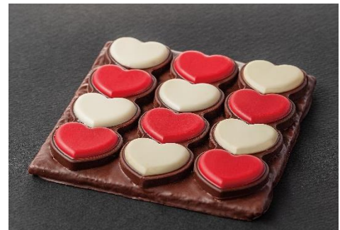
タブレット クール ノワール (12) 6,480円（税込）