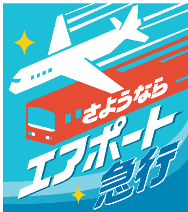
取り付けるヘッドマーク

さらに、11月23日（木・祝）に京急蒲田駅改札外にて記念グッズの催事販売を行います。京急電鉄では、今回のようなイベントを通じて、皆さまに生活の足として「愛される京急」を目指し、今後も取り組んでまいります。詳細は別紙のとおりです。