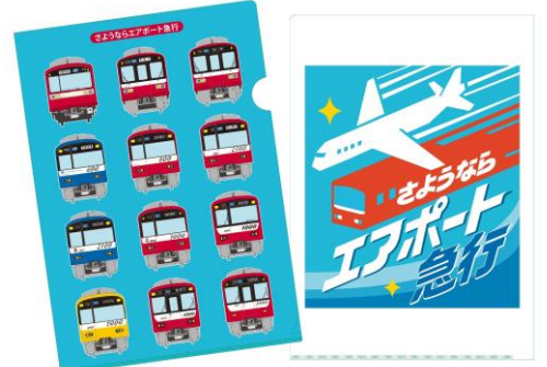
販売する商品の一例 クリアファイル2種類