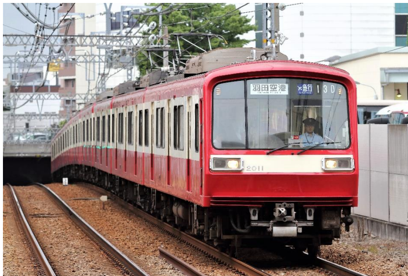
今はなき 2000 形の「エアポート急行 羽田空港行」

「エアポート急行」の種別は2010年5月16日（日）のダイヤ改正により運行を開始し、約13年間運行して11月24日に運行を終了します。エアポート急行が誕生する以前は、羽田空港と浦賀・新逗子（現：逗子・葉山）間を結ぶ特急（途中の京急川崎～金沢文庫駅間は快特に連結）が運行されていました。この種別変更を廃止して一本の列車とさせたのがエアポート急行です。