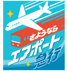
ヘッドマークイメージ