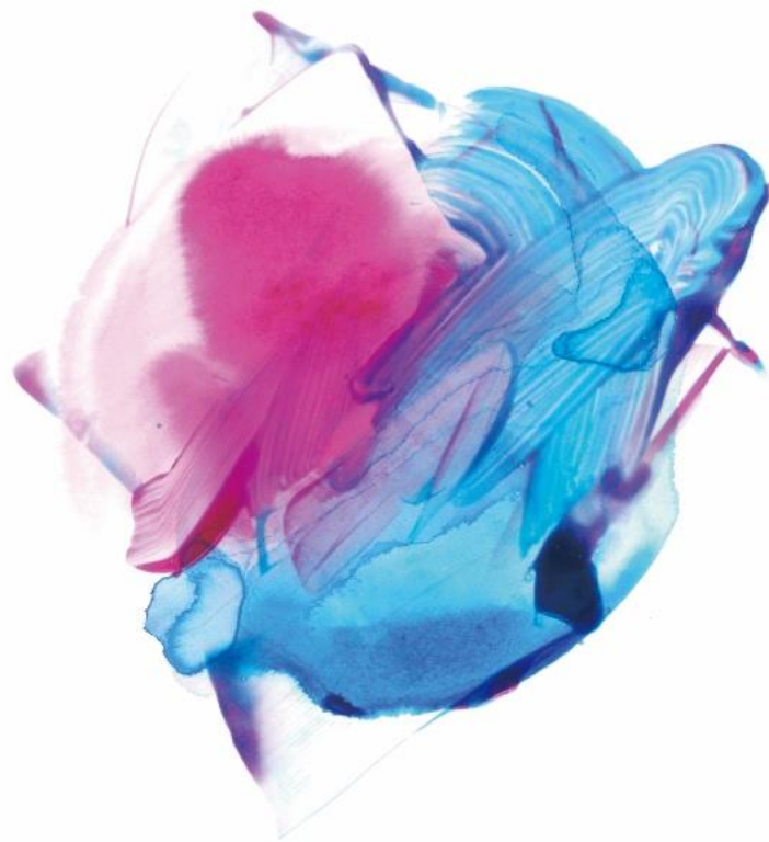
HANEDA INNOVATION CITY キービジュアル