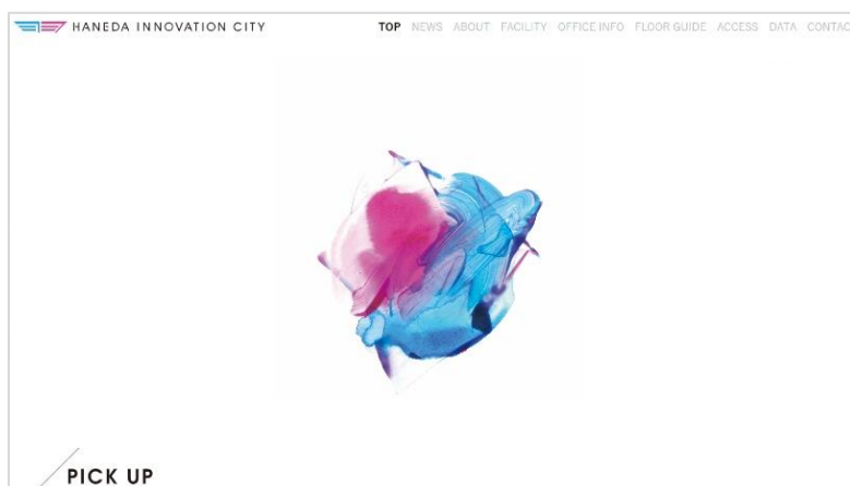
施設公式ホームページ トップ画面

既存のロゴとは別に、街のコンセプトや姿勢を表現したキービジュアルを設け、HICityの各種コミュニケーション媒体のビジュアルを刷新します。