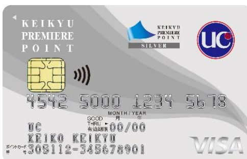
京急プレミアムポイントシルバー (UCブランド)