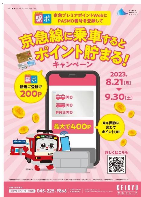
ポスターイメージ画像