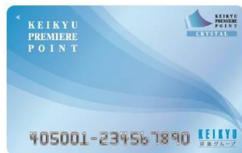
京急プレミアムポイントクリスタル