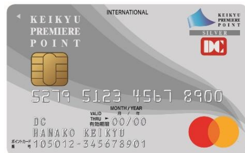
京急プレミアムポイントシルバー (DCブランド)