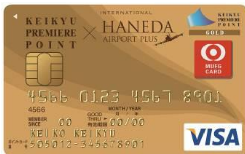
京急プレミアムポイントゴールド HANEDA AIRPORT PLUS