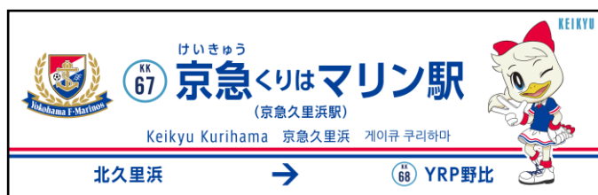
駅名看板の装飾 ※イメージ