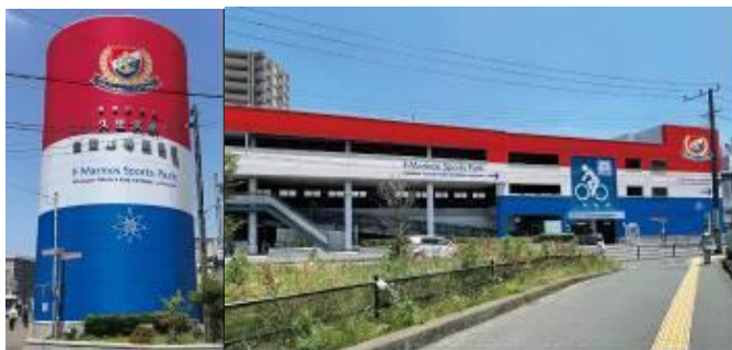
久里浜駅自転車等駐車場※イメージ