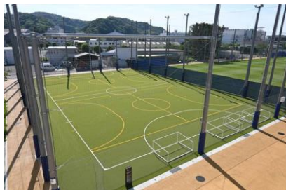
フットサルコート