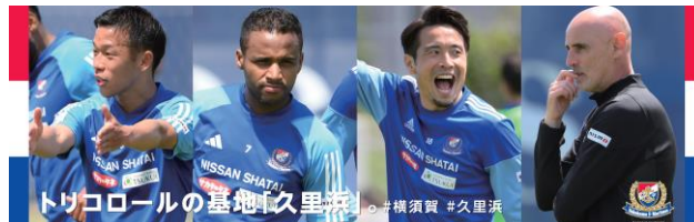
車内の中吊り一例 ※イメージ