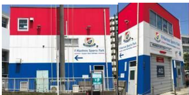
消防団第40分団詰所※イメージ

2023年6月5日（月）から、久里浜駅近接の久里浜駅自転車等駐車場および、横須賀南警察署敷地隣接の消防団第40分団詰所の外壁を横浜F・マリノスのシンボルカラーである赤・白・青のトリコロールカラーに装飾します。自転車等駐車場の総装飾面積は約772㎡、久里浜にお越しになる方々をトリコロールでお迎えします。消防団第40分団詰所は、駅からF・マリノススポーツパークに向かう際の最後の曲がり角に位置しており、F・マリノススポーツパークにお越しになる方々へのガイドの役割も果たします。