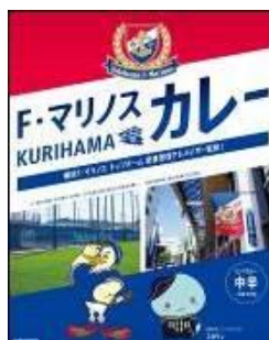
パッケージイメージ