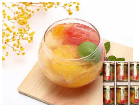
初登場【ふみこ農園】 若桃入りフルーツコンポート6本 4,536円(税込)