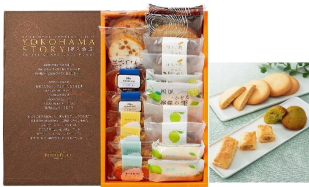
京急百貨店限定 横浜物語 3,240円(税込)