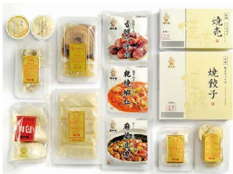
バラエティセット 10,800円(税込)