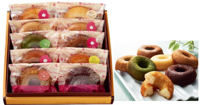
京急百貨店オリジナルセット 3,980円(税込)