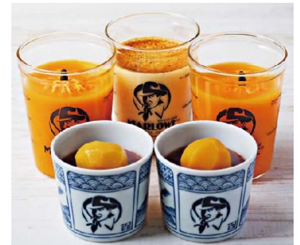
栗水ようかんと有田みかんの ジュレセット 5,930円(税込)