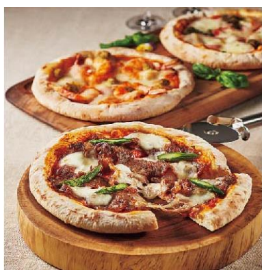
初登場【ANAフーズ】 淡路島を味わうピッツァ 5,400円(税込)