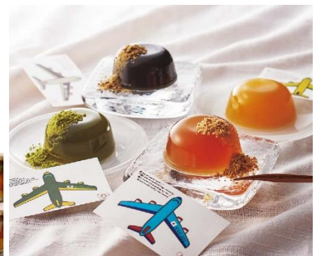
初登場【川崎大師・大谷堂】 わらび餅 5,400円(税込)