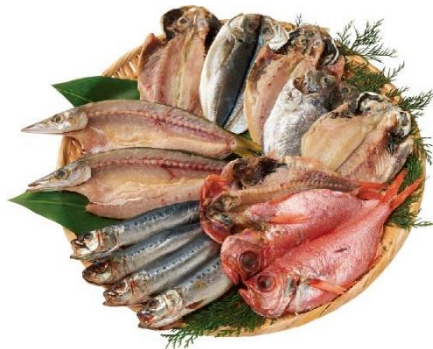
ひもの詰合せ 4,860円(税込)