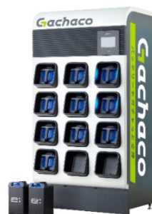
バッテリー交換ステーション