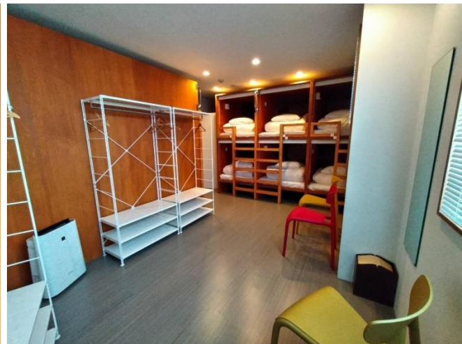
リニューアル後の8名ドミトリー