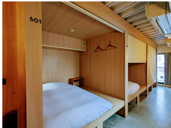
リニューアル後のドミトリー