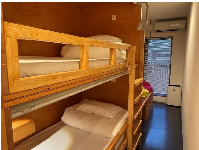
リニューアル後の2名個室