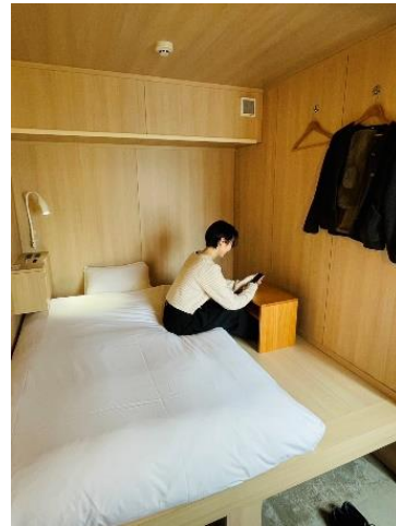
リニューアル後の1名ドミトリー