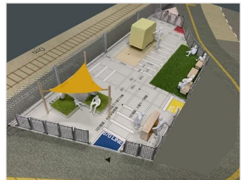
「Park Line 870」イメージ