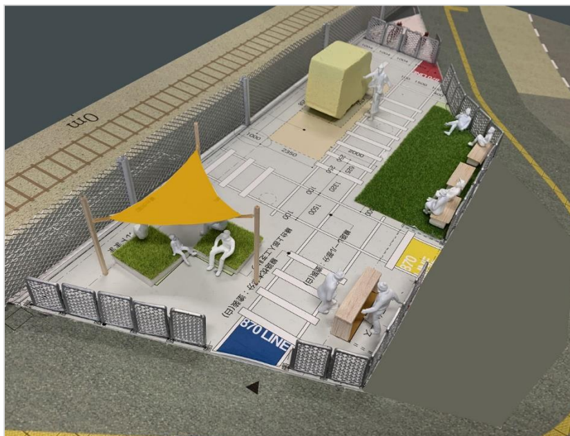
「Park Line 870」イメージ