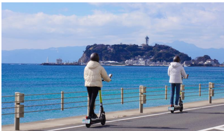
（写真）電動キックボード乗車イメージ

また，アプリによる無人でのレンタルを行うほか，GPSによる速度制限や走行可能範囲等，システムによる安全対策も実施します。詳細は別紙のとおりです。