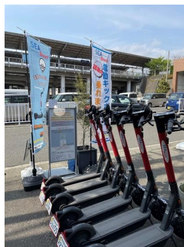
（写真）三浦海岸駅前ポート