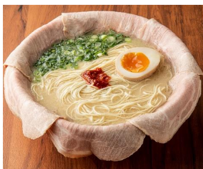
特製こぼれチャーシュー麺 (1杯)・・・1,250円(税込)