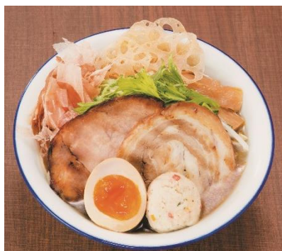
【京急百貨店オリジナル】 最上のQラーメン <各日限定100杯> (1杯)・・・1,300円(税込)

新登場！最後の一滴まで飲み干せる！鶏出汁塩ラーメン！【鹿児島県/サカノウエユニーク】