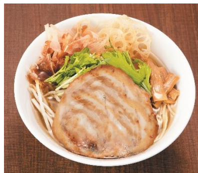
いいとこ鶏ラーメン (1杯)・・・1,000円(税込)