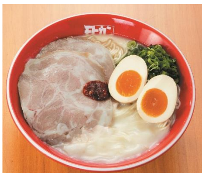
極上豚骨モヒカンらーめん 煮卵入り (1杯)・・・950円(税込)

湯気まで美味しい！九州豚骨！コクがあるのにさっぱりな名物スープ【福岡県/モヒカンらーめん】