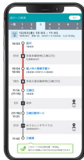
「温室効果ガス 排出削減量可視化機能」 イメージ