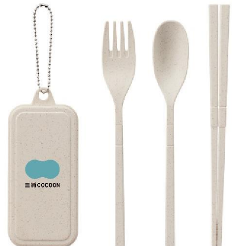
三浦 COCOON オリジナルカトラリーセット