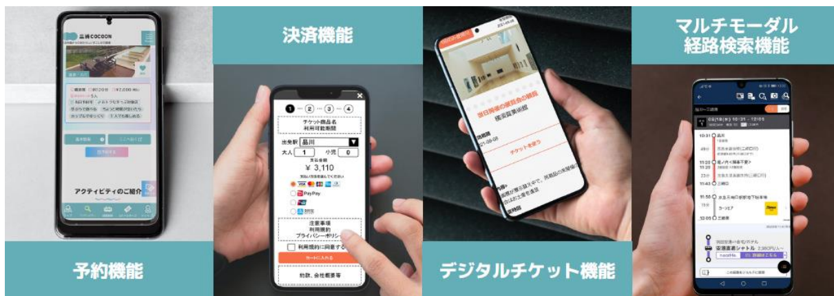
「三浦 COCOON」画面イメージ