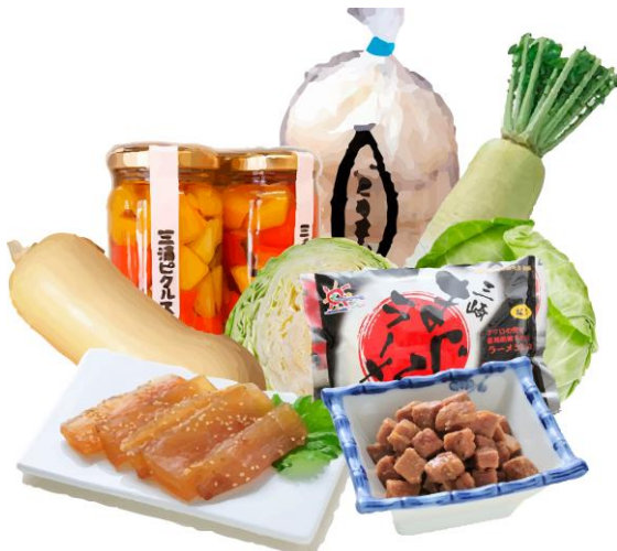
三浦半島まるごと詰め合わせセット ※画像はイメージです