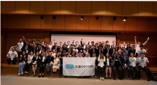
「COCOONファミリーMeetup!」の様子

なお，この一連の事業は国土交通省「令和4年度日本版MaaS推進・支援事業」に採択されています。観光型MaaS「三浦COCOON」では，地域連携によるMaaSの活用を通じ，持続可能な観光モデルづくりを今後も推進いたします。詳細は別紙のとおりです。