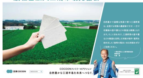
「COCOON ファミリー」の環境への取り組みを紹介したポスター例