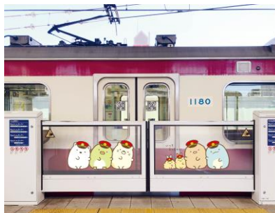
ホームドア装飾イメージ