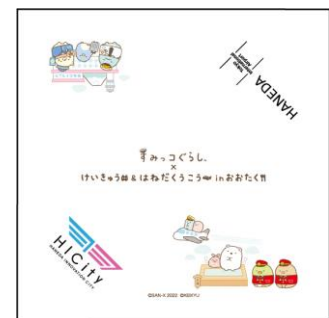
オリジナルタオル