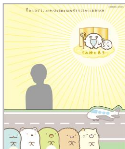
第1ターミナル5F THE HANEDA HOUSE