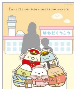
第2ターミナル5F フライトデッキトーキョー