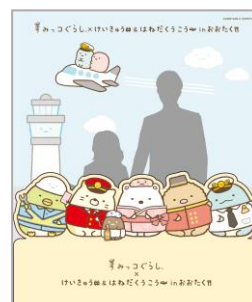
第3ターミナル5F お祭り広場