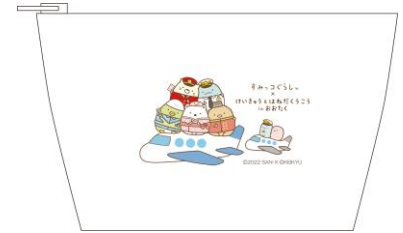
オリジナルポーチ