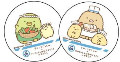
オリジナルマグネット（全10種）