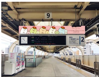
列車発車案内装飾イメージ