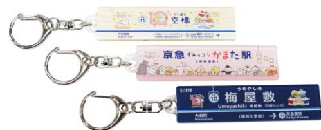
駅装飾看板アクリルキーホルダー全14種 各601円（参考税込価格）