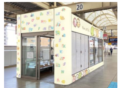
待合室装飾イメージ