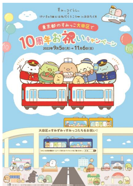
メインビジュアル

なお，サンエックスが鉄道会社や空港旅客ターミナル運営会社などの「企業」・大田区などの「自治体」・商店街や銭湯などの“地元”「商店」と地域一体で連携し，キャンペーンを実施するのは初となります。