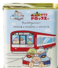
サクマドロップス 401円（参考税込価格）

※販売開始日および取扱店舗は、特設サイトまたはオンラインショップ「おとどけいきゅう」をご覧ください。