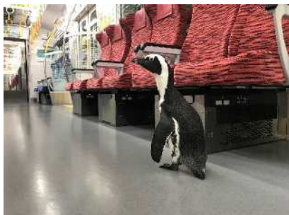
ペンギンへのタッチ