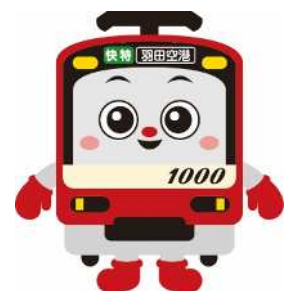
京急電鉄マスコットキャラクター けいきゅん