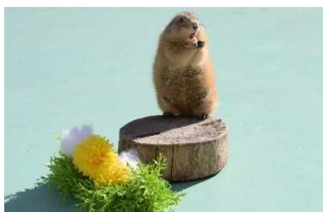
プレーリードッグのお散歩見学 ※写真はすべてイメージです