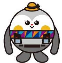
横浜シーサイドライン イメージキャラクター キラキラ☆シーたん