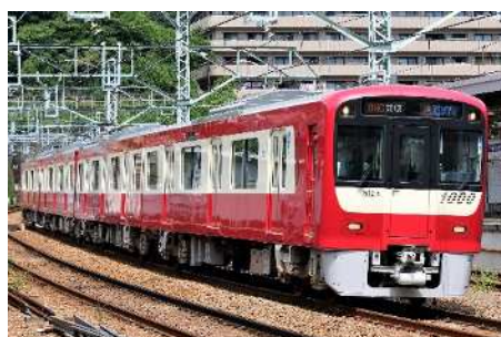
貸切列車 (Le Ciel)