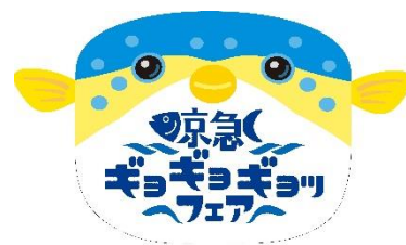
ヘッドマークデザイン イメージ