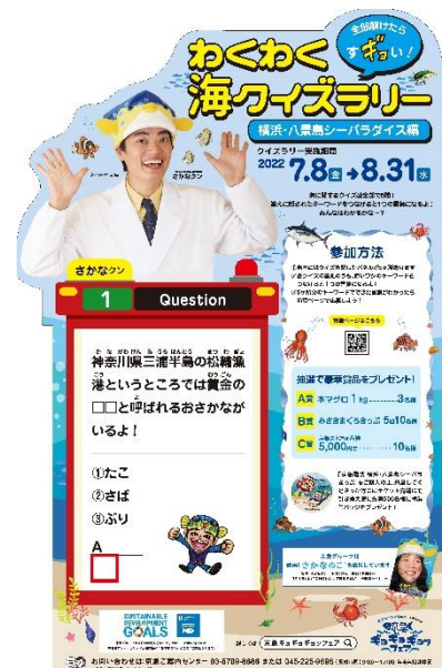
クイズラリー等身大パネルイメージ