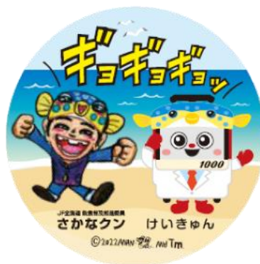
缶バッジイメージ