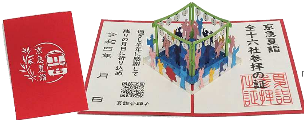
オリジナルグッズ 「京急夏詣 参拝の証」