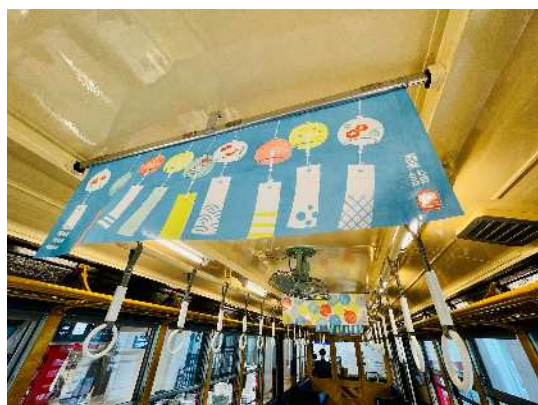
手ぬぐい風特設中吊り イメージ

京急電鉄は，明るい未来を願う皆さまのお気持ちに寄り添える，さまざまな企画を行ってまいります。詳細は別紙のとおりです。