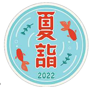
ヘッドマークデザイン