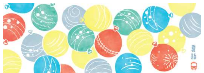
手ぬぐい風特殊中吊りポスター2種類 イメージ