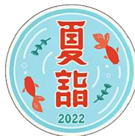
歴代夏詣ヘッドマークデザイン ステッカーイメージ