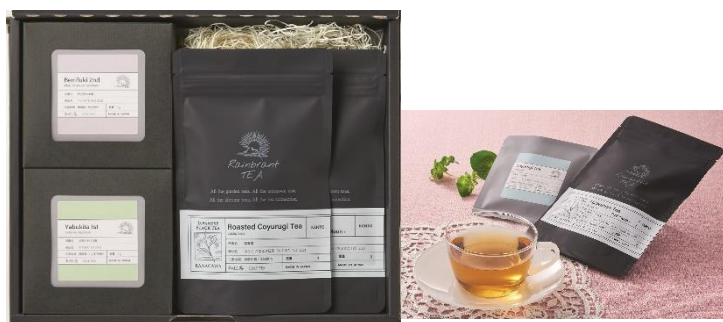
横浜【レインブランドティー】