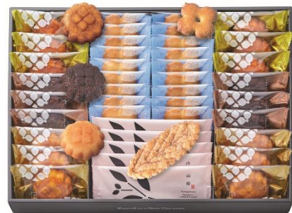
鎌倉咲菓 41個入 5,400円(税込)