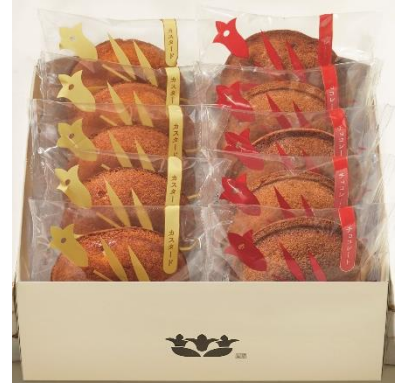
かまくらカスター詰合せ 3,240円(税込)