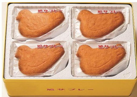
鳩サブレー34枚入 4,320円(税込)