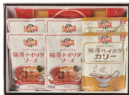
横浜【センターグリル】