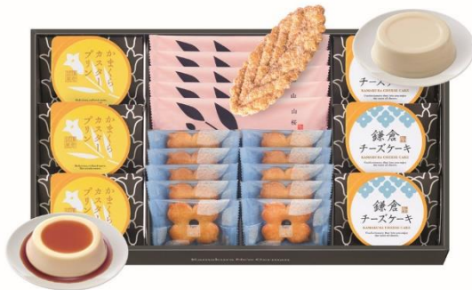
鎌倉涼菓 21個入 3,240円(税込)

なめらかでコクのあるカスタードプリン、濃厚な味わいのチーズケーキと、鎌倉の風物をモチーフにしたスイーツの詰合せです。