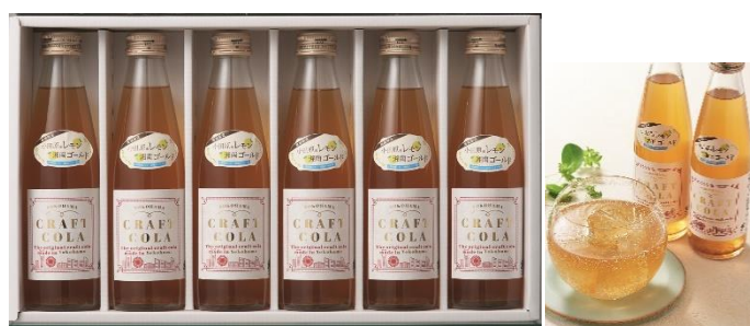
横浜【スープカレーKIFUKU】