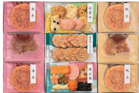
海匠焼詰合せ 3,240円(税込)