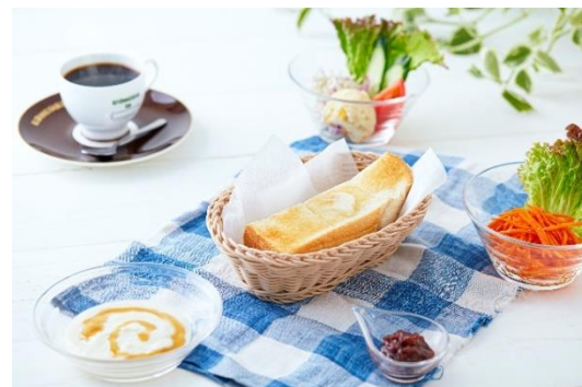
朝食メニューイメージ

メニュー: 3. 5cm厚切りハーフトースト, 選べるトッピング(ジャム・小倉あん・豆乳クリームチーズ・本日のスープ), 選べるドリンク(18種), ベジサラダ, Soyヨーグルト