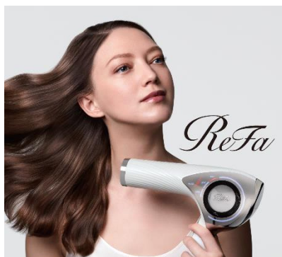
ReFa BEAUTECH DRYER