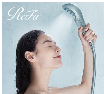
ReFa FINE BUBBLE S

このほか、本プランで宿泊日または翌日に、ホテル近隣の Beauty Connection Ginza にご来場いただくと、パンフレットのご呈示で ReFa 製品を税込価格の5%オフで購入できるなど、銀座で美しくなる2日間をお過ごしいただけます。詳細は別紙のとおりです。