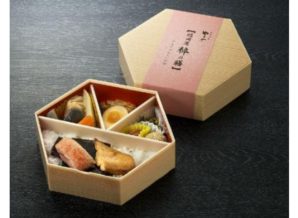
【やまや】めんたい彩膳 （1折）1,350円（税込）