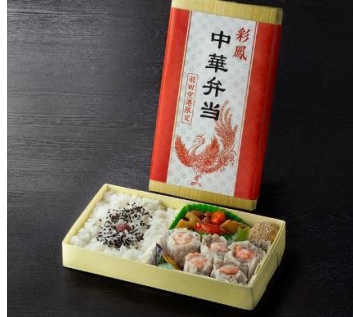
【彩鳳】中華弁当 （1折）951円（税込）