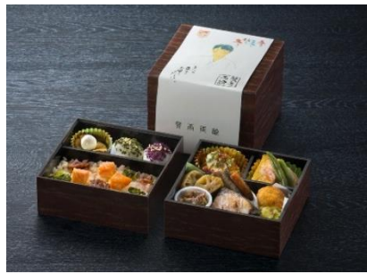
【賛否両論】監修 季節の二段重（冬） （1折）1,681円（税込）