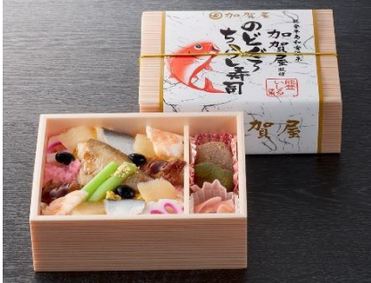
【加賀屋】監修 のどごろちらし寿司 （1折）1,392円（税込）