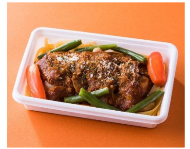
機内食セレクション（4種、冷凍） （1折）875円（税込）より ※写真は「コック・オー・ヴァン」 ※ご家庭でお楽しみいただける味付けに アレンジしております。