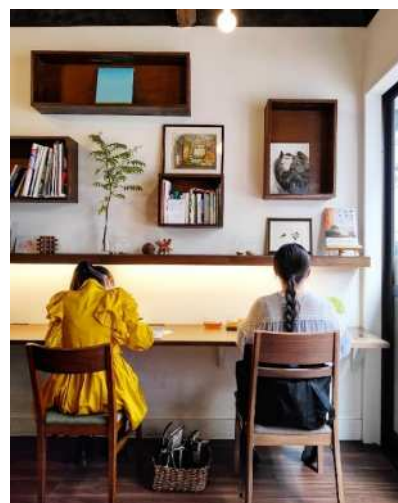
自由丁の利用の様子