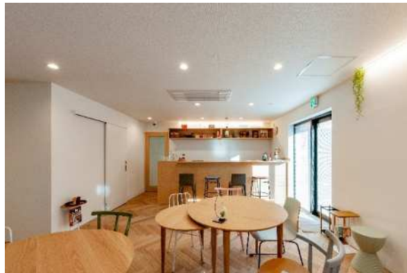
plat hostel keikyu haneda home