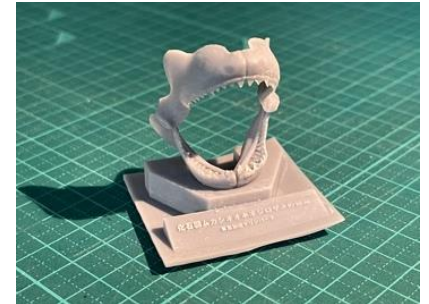
ムカシオオホホジロザメの3Dプリントフィギュア（イメージ）

京急油壺マリンパークを最新技術を用いて3D化し、バーチャル空間に再構築した「VR京急油壺マリンパーク」を2022年夏（予定）にインターネット上で公開します。また、「VR京急油壺マリンパーク」内にこれまで京急油壺マリンパークを訪れた人々の思い出や写真、京急油壺マリンパークの資料を展示する「思い出館」を公開します。これらの参加者を募り、資金を調達するためにクラウドファンディングを行います。