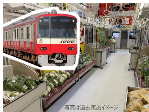
浦賀・開国駅マルシェ イメージ