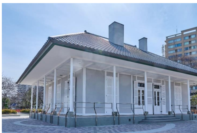
よこすか近代遺産ミュージアム ティボディエ邸

リニューアルしたよこすか京急沿線ウォークを通して, 今後も横須賀市を中心とした三浦半島の魅力向上に努めてまいります。詳細は別紙のとおりです。