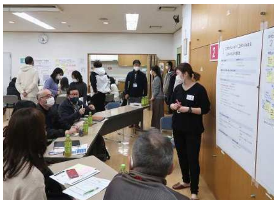
まちづくりワークショップの様子

本会場（富岡・能見台各地域ケアプラザ・事前申込制）ではイメージブックの理解を深めるトークイベントやプロジェクト案の紹介を行います。また、気軽にお立ち寄りいただける屋外のサブ会場では、これまでの取組を紹介するパネル展示、昨年度までの地域交通実証実験で用いた電動小型カートの車両展示等を行います。 ※詳細は裏面をご覧ください。