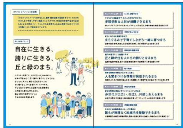
イメージブックの内容（抜粋）