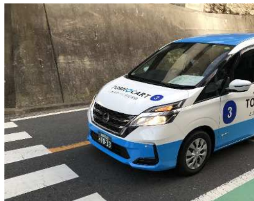
昨年度 地域交通実証実験の様子