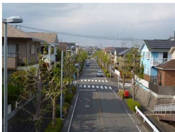
富岡・能見台の街並み