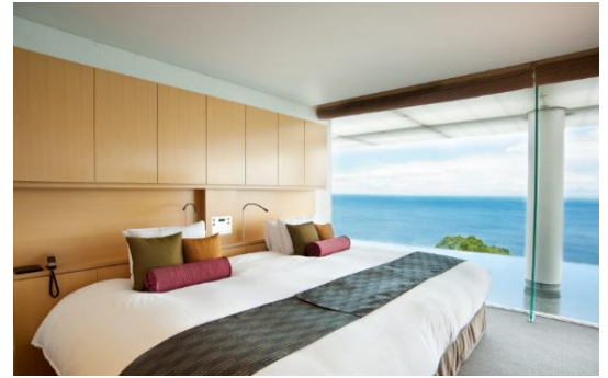
ふふシリーズ 客室イメージ