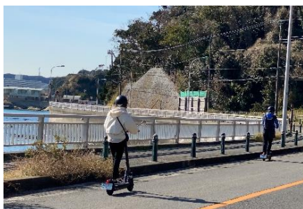
電動キックボード乗車イメージ

今後，この連携のもと横須賀市内および三浦半島にパーキングステーションを増やすことで広域観光の強化を行うことを目指します。詳細は別紙のとおりです。