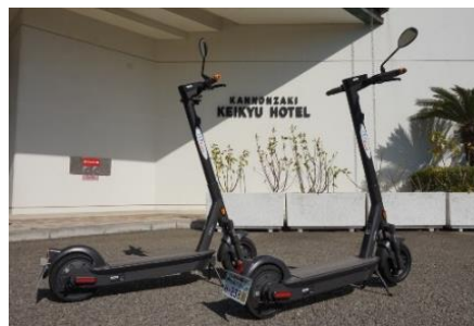
セグウェイ・ナインボット製電動キックボード