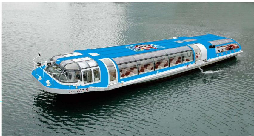
新しくラッピング装飾をする「シーバス5号」（画像はイメージです）