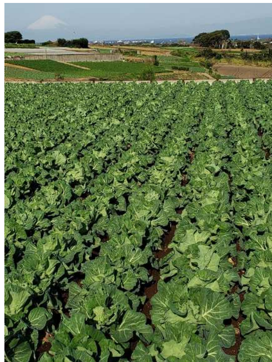
河田農園のキャベツ畑（富士山をバックに）