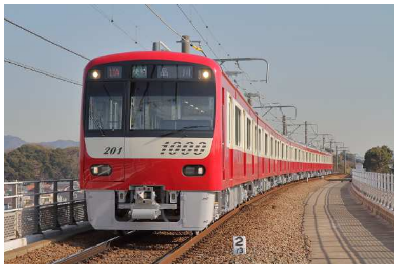
京急の車両イメージ