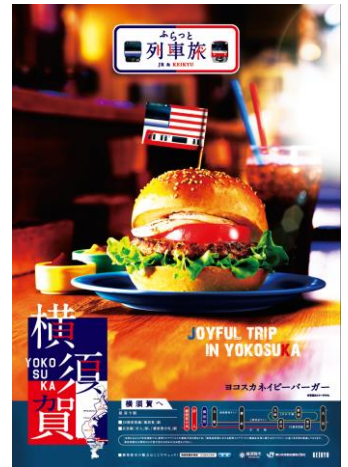
【プロモーションポスター(イメージ)】

両社の沿線自治体である横須賀市と連携し、JR東日本・京急電鉄の鉄道媒体を利用して、首都圏を中心とした駅や車内でのプロモーションを実施します。横須賀市の名物である「ヨコスカネイビーバーガー」をメインに宣伝展開を行います。