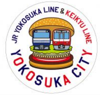
【コースター (イメージ)】

※緊急事態宣言が延長となった場合、プレゼント開始は緊急事態宣言終了後に延期となります。