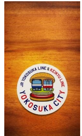
【スマホ用壁紙(イメージ)】