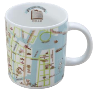
オリジナルマグカップ