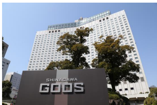
2011年 シナガワグース開業