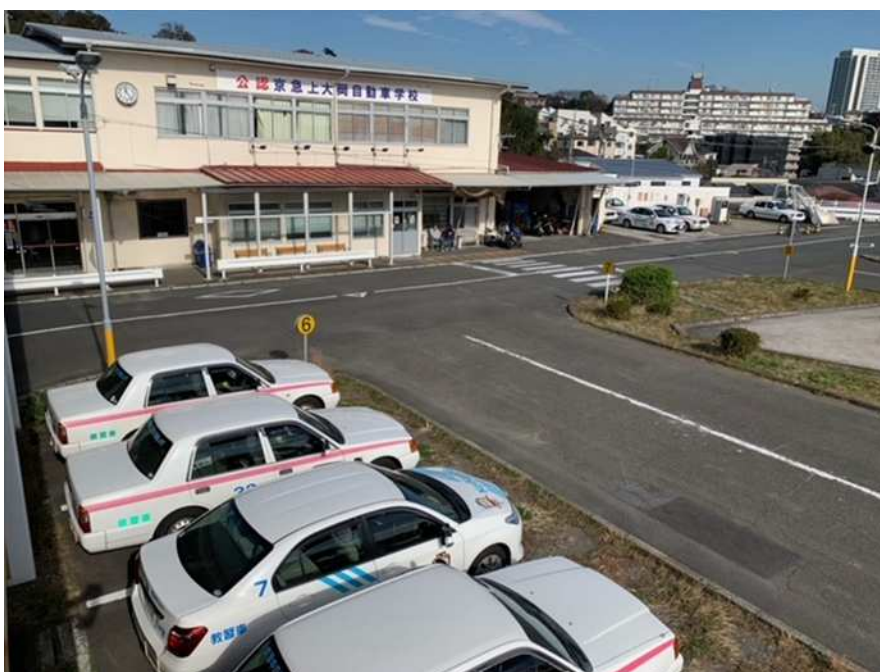
京急自動車学校上大岡校 外観写真

<参 考> 京急自動車学校 上大岡校 について 所 在 〒233-0003 横浜市港南区港南2-12-1 取扱車種 普通車／普通二種／大型二輪／普通二輪／小型二輪／大特車 WEBサイト https://www.keikyu-driving.co.jp/