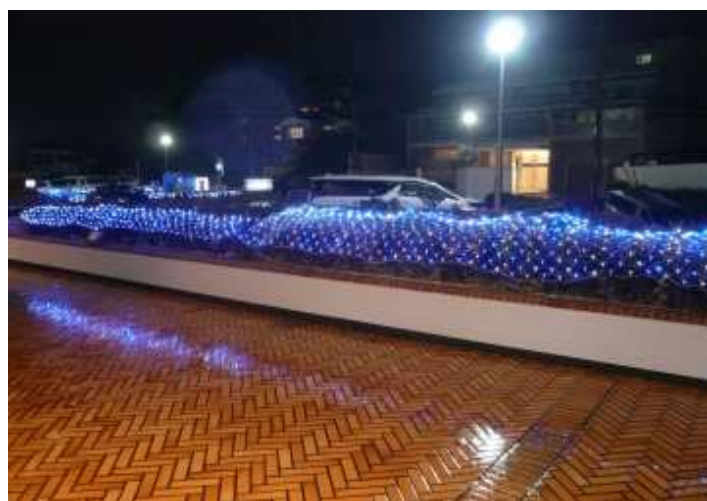
昨年実施した通常のライトアップ（エントランス）