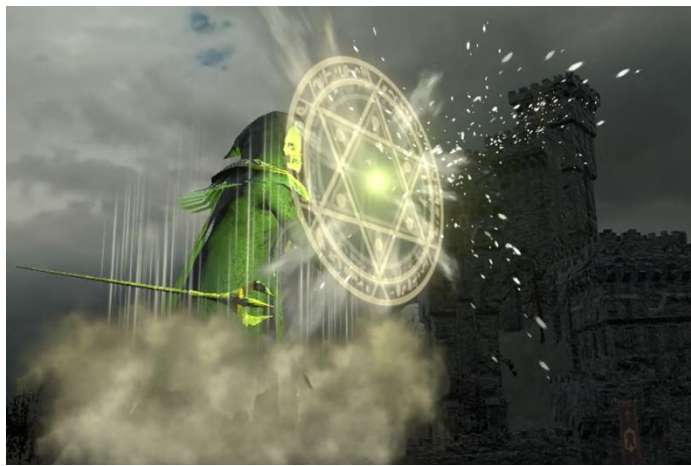
XR 観光バスツアー@横浜のアイデア例 (イメージ)