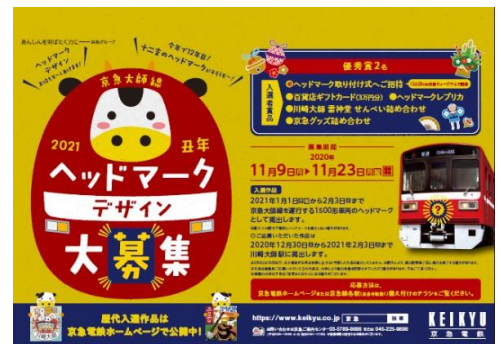
ポスター（イメージ）