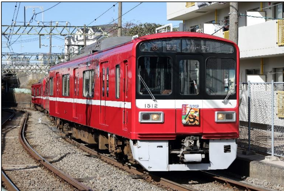
ヘッドマークを掲出した2020年の京急大師線

京急電鉄の「新年の“顔”」となる，素晴らしい京急大師線ヘッドマークデザインのご応募をお待ちしております。詳細は別紙のとおりです。