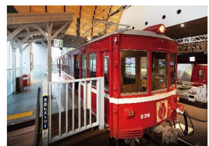
ヘッドマーク取り付け式を行うデハ 230 形

入選者を京急ミュージアムへ招待し、大師線が現役最後の活躍場所であったデハ 230 形に自身がデザインのヘッドマークを取り付けるイベントを実施する。